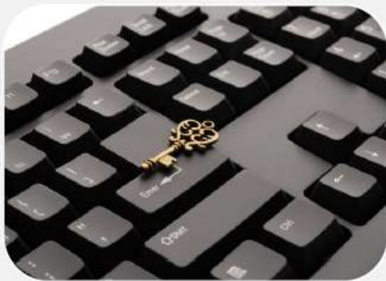
Indicador EQAVET 5a)

Destino dos formandos após a conclusão da formação