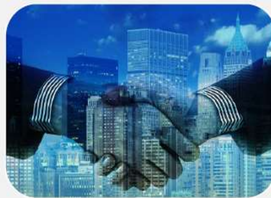
Indicador EQAVET 6a)

Destino dos formandos após a conclusão da formação