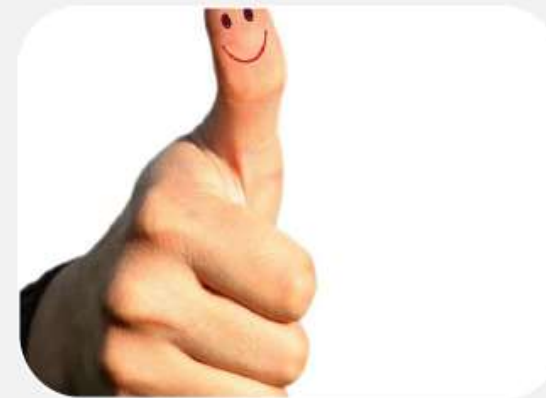
Indicador EQAVET 6b) 3

Satisfação dos formandos e dos empregadores