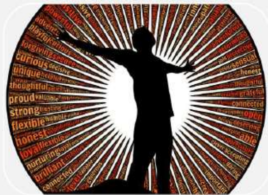
Indicador EQAVET 4a)