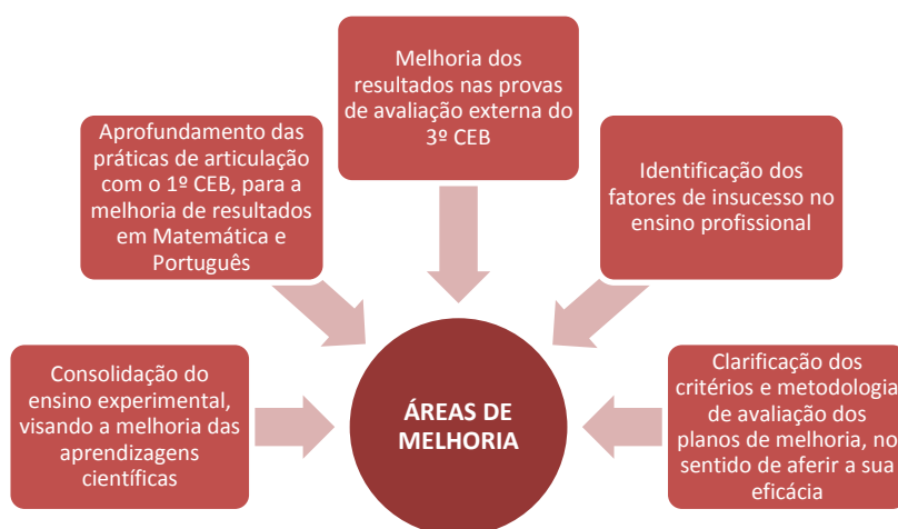
FIG. 2 ÁREAS DE MELHORIA

Foram cinco as áreas de melhoria assinaladas pela Inspeção Geral de Educação e Ciência aquando da última avaliação externa ao AEB, que decorreu no ano letivo de 2012/2013. Na sequência daquela avaliação, foi elaborado e implementado um Plano de Melhoria integrando diferentes ações de melhoria para cada uma das supramencionadas áreas, como se pode verificar pelas tabelas seguintes. A avaliação da eficácia de cada uma delas passará pela análise do cumprimento das respetivas metas/indicadores.